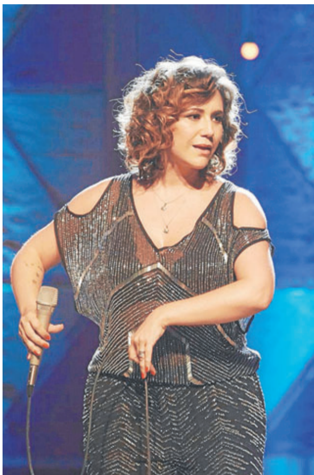
►► La cantante María Rita.

Maria Rita será la primera en llegar, con un recital fijado para el 21 de marzo. La artista de 37 años lleva una década entre los nombres más destacados del género en su